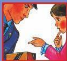
НА УЛИЦЕ ИЛИ В МЕТРО- ПОЛИЦЕЙСКОМУ