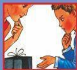
В МАГАЗИНЕ- ПРОДАВЦУ