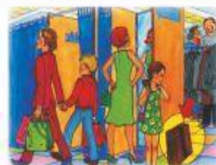
В ОБЩЕСТВЕННЫХ МЕСТАХ