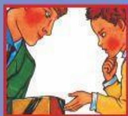
В ТРАНСПОРТЕ- ВОДИТЕЛЮ